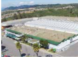
Viña del Mar