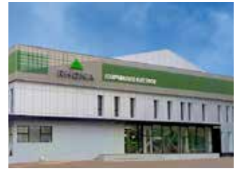
Santiago - Panamericana